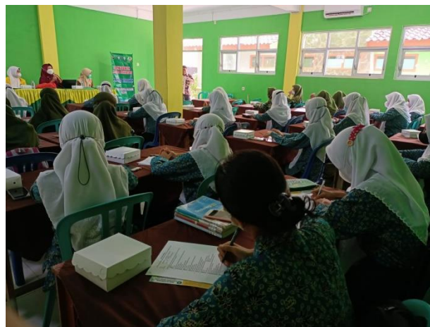
Gambar 2. Gambar Penyuluhan tentang isu terkini Masalah kesehatan reproduksi pada remaja di SMA N 1 Plemahan

Kurangnya pengetahuan terkait dengan anemia pada remaja merupakan salah satu faktor yang berpengaruh terhadap kejadian anemia pada remaja. Rendahnya pengetahuan pada remaja juga berpengaruh terhadap perilaku remaja dalam menjaga kesehatan terutama yang berhubungan dengan kesehatan reproduksi remaja. Keluhan yang dialami oleh remaja kadang kala dianggap sebagai hal yang normal dan biasa dialami oleh remaja.