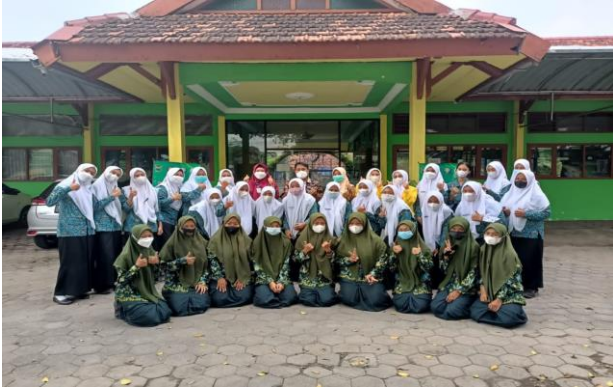
Gambar 3. Gambar Penyuluhan tentang isu terkini Masalah kesehatan reproduksi pada remaja di SMA N 1 Plemahan

Masa remaja membutuhkan pendekatan yang dapat menggerakkan kesadaran. Peningkatan pengetahuan melalui penyuluhan diharapkan dapat meningkatkan keberhasilan program pencegahan anemia [4].