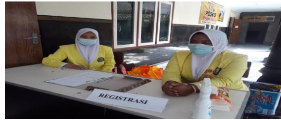
Dokumentasi TIM Pengabdian masyarakat beserta panitia kader kesehatan.

Berikut foto dokumentasi pelaksanaan kegiatan pengabdian masyarakat: