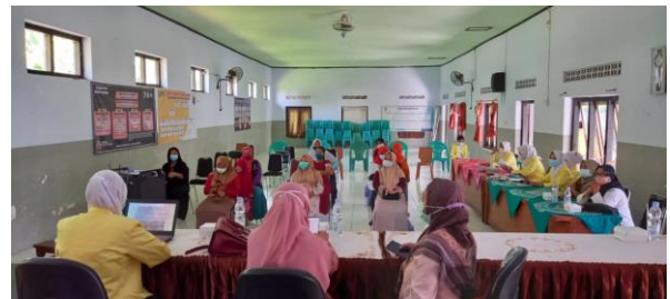
Dokumentasi peserta Persiapan Pemberian ASI Eksklusif.